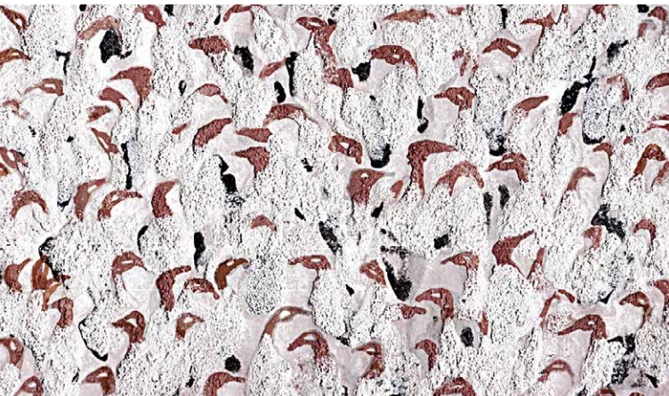
Geflügel, 2017, Pigment auf Papier, 21 x 30 cm