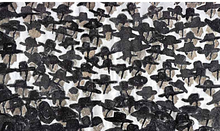
Ultra, 2016, Pigment auf Papier, 21 x 30 cm