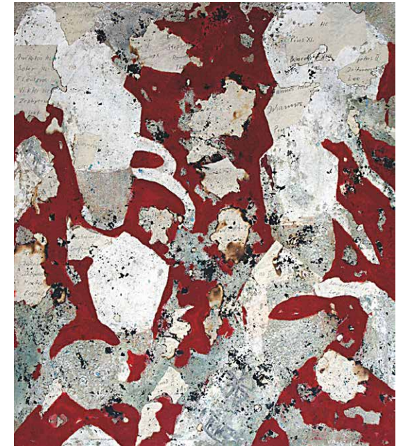
Papstwahl, 2005, Mischtechnik, Collage, 119 x 102 cm

HELIOS Kliniken Jeder Moment ist Medizin