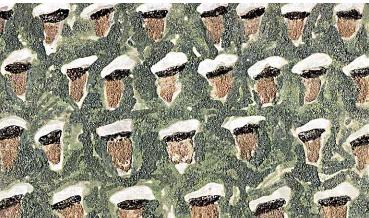
Polizistinnen, 2015, Pigment auf Papier, 20 x 33 cm