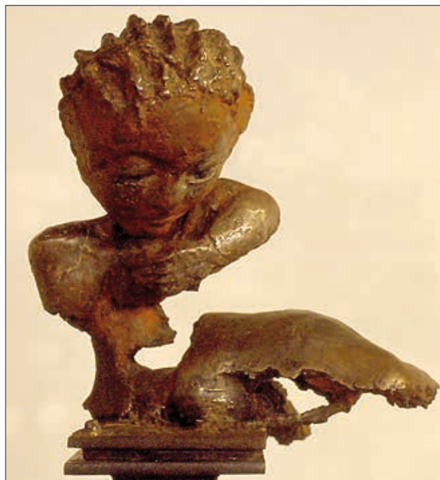
Irrlicht oder trauernde Seele, Eisenguss, 34 x 34 x 24 cm, 2002/05