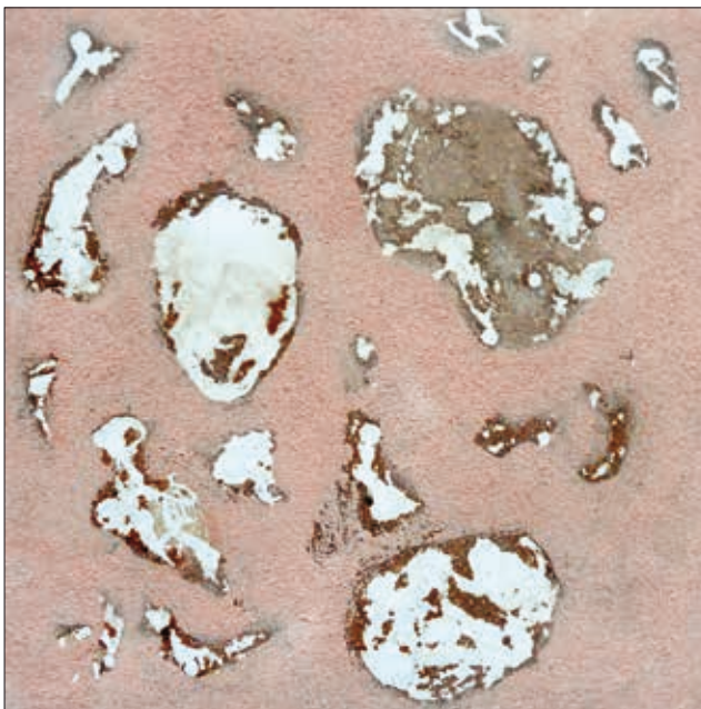
Fund, Mischtechnik auf Leinwand, 36 x 36 cm, 2007