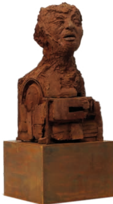
Porträt Marianne Brandt, Eisenguss, 106 x 50 x 50 cm, 2002/04

Schwerpunkt der künstlerischen Arbeit Anna Franziska Schwarzbachs ist die Darstellung des Menschen - expressiv, fragmentarisch, ungeachtet jeglicher Normen und Ideale. Seit Ende der 1980er Jahre bevorzugt sie dafür den Eisenguss. Ihre zahlreichen Medaillen sowie die ca. 30 Skulpturen im Stadtraum, in Museen und Kirchen beleben das alte Berliner Eisen der Schinkelzeit neu, jedoch ohne dessen edle Schwärze und Strenge. Oxidierende Partien, eigenwillige Verläufe des Eisens, überhaupt alle Zufälligkeiten beim Guss werden eingebunden in eine offene und doch ganzheitliche Figürlichkeit, die existentiell berührt. G. I.